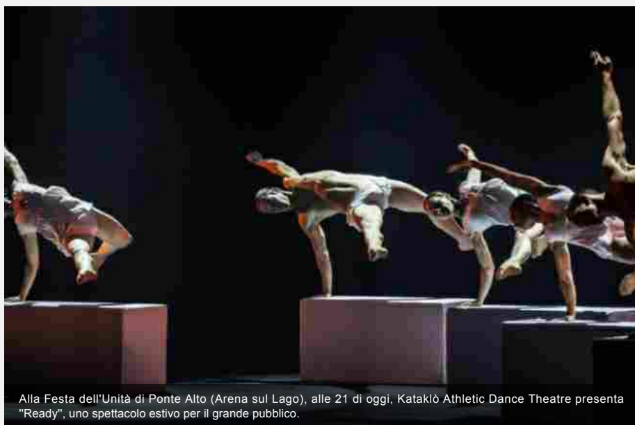
Alla Festa dell'Unità di Ponte Alto (Arena sul Lago), alle 21 di oggi, Katakò Athletic Dance Theatre presenta "Ready", uno spettacolo estivo per il grande pubblico.